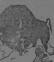
El Bionte Americano

Este rápidamente extinguido; pero este hecho no puede inquietar a las señoras de casa. Su interés está concentrado en que gracias al Sunlight Jabón el terror del día del lavado ha pasado y se extingue por completo. Con el Sunlight Jabón como auxiliar, el lavado se termina rápidamente. El trabajo se aminora con su uso, se gana tiempo y se conservan las ropas. El Sunlight Jabón hace todo el trabajo. Para este objeto se ha ideado.