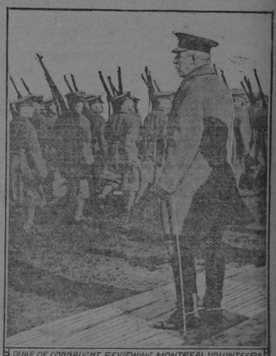
DUKE OF CONNAUGHT REVIEWING MONTREAL VOLUNTEERS

EL DUQUE DE CONNAUGHT, GOBERNADOR DEL CANADA, REVISTANDO A UN CUERPO VOLUNTARIO DE CANADIENSES, HIJOS DE LA CIUDAD DE MONTREAL.